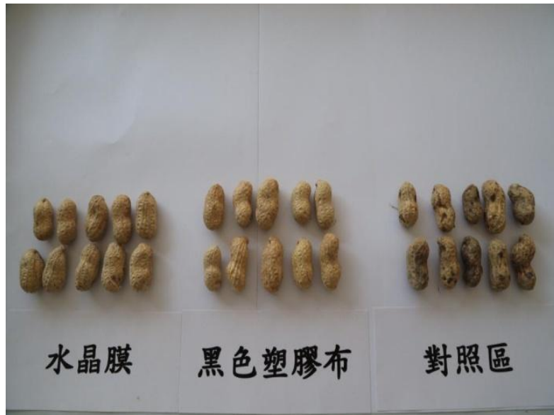
圖 5.不同色彩之塑膠布覆蓋落花生果莢品質比較