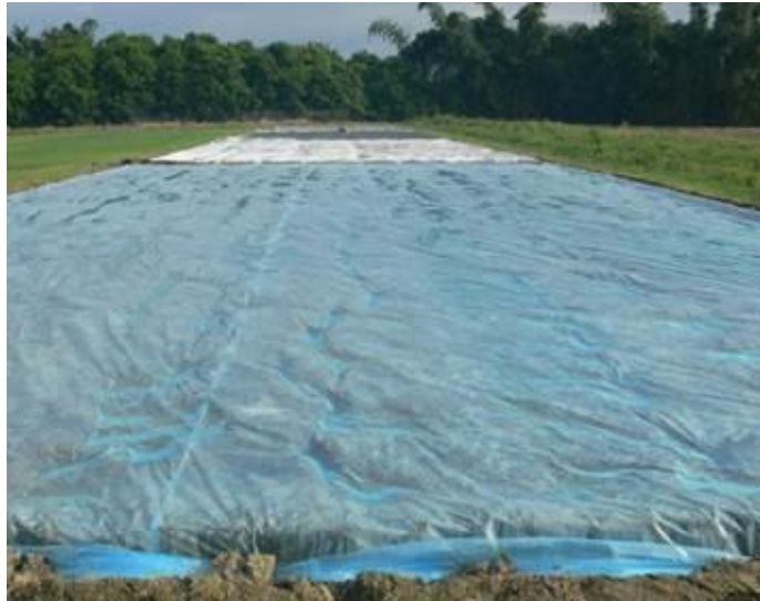
圖 1.不同色彩之塑膠布田間覆蓋試驗情形