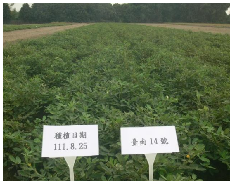
圖 4 不同色彩之塑膠布覆蓋試驗後落花生田間種植情形

本試驗不同色彩之塑膠布覆蓋下，對落花生病原菌之影響，以覆蓋水晶膜或黑色塑膠布，降低土壤病原菌含量表現較佳。在不同色彩之塑膠布覆蓋下，檢測土壤病原菌(細菌類、真菌類)總量結果顯示，真菌數量愈少者，果莢黑斑病罹病率愈低。顯示利用太陽能可達到聚熱殺菌之效果。總體而言覆蓋塑膠布可明顯提高土壤溫度最高至 46.0°C，真菌數可降低 81-99%。降低落花生果莢黑斑病危害率 48-88%。降低雜草密度 8-71%，提升落花生作物的產量及品質。