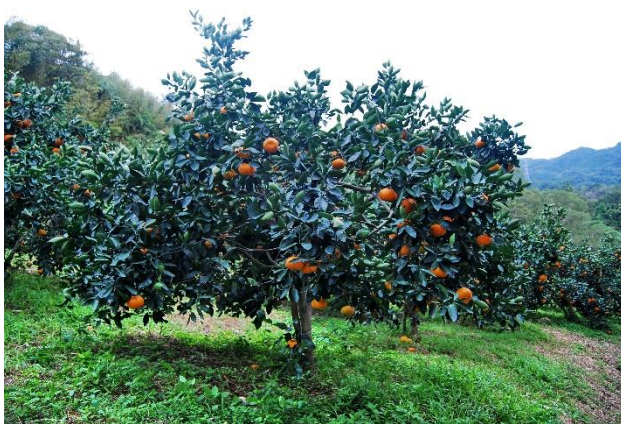
圖 1、「寬皮柑台農天王柑」結果情形

本品種適於柑橘產區土壤良好者種植。其果形極大，但著果過多時較小。氣溫較高地區或產量較少者不宜晚採，以免發生浮皮。8 月至 10 月間可能發生裂果，排水良好的園地與適時灌溉可減少發生機會。肥培管理參照柑橘類之施肥量，施肥時期與柳橙相當。枝梢節間較長，宜注重短梢修剪，以增進產量及減少結果枝梢斷裂。病蟲害防治與一般柑橘類相同。