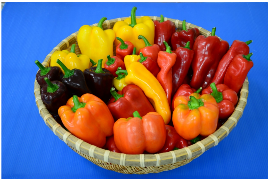
圖一、以「彩椒果色性狀分子標誌」分析，可區分出不同果色彩椒