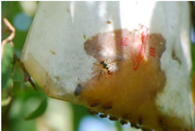
果實蠅停留於桃果實上

本旬報每月發行3次，提供農政單位、試驗機構及產銷班掌握害蟲資訊，若需索取書面原始密度資料請另洽。為方便相關單位掌握此項訊息，另建置專屬網頁，供各界下載瀏覽，網址為 http://www.tari.gov.tw/form/index.asp?Parser=3,9,56 ，每旬更新一次。