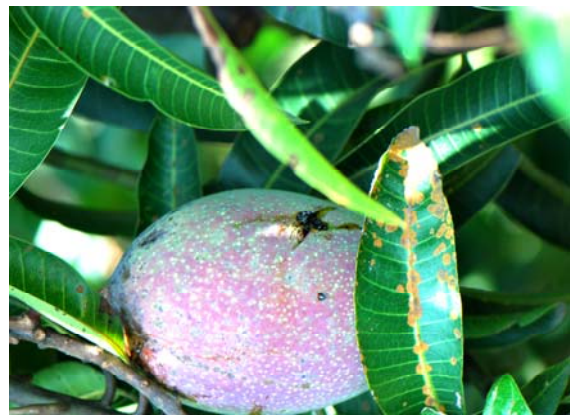
果實蠅於檸檬果實上產卵