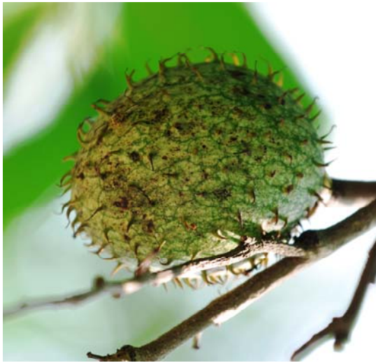
果實蠅危害刺番荔枝

本旬報每月發行3次，提供農政單位、試驗機構及產銷班掌握害蟲資訊，若需索取書面原始密度資料請另洽。為方便相關單位掌握此項訊息，另建置專屬網頁，供各界下載瀏覽，網址為 http://www.tari.gov.tw/form/ ，每旬更新一次。