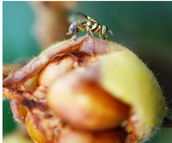
果實蠅停留於枇杷果實