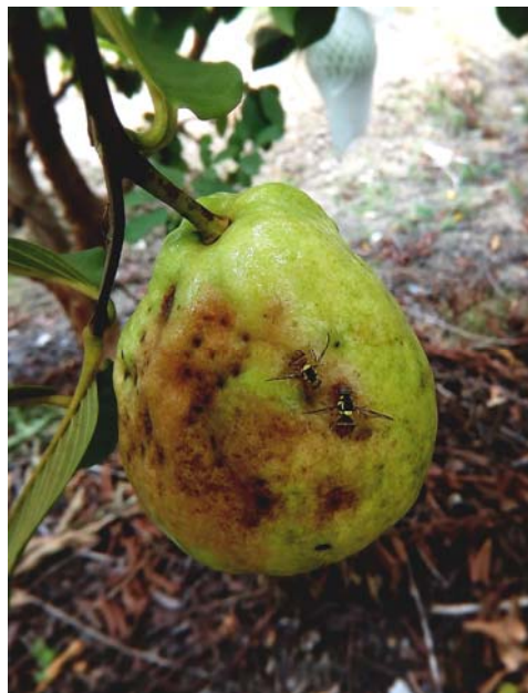
果實蠅為害番石榴