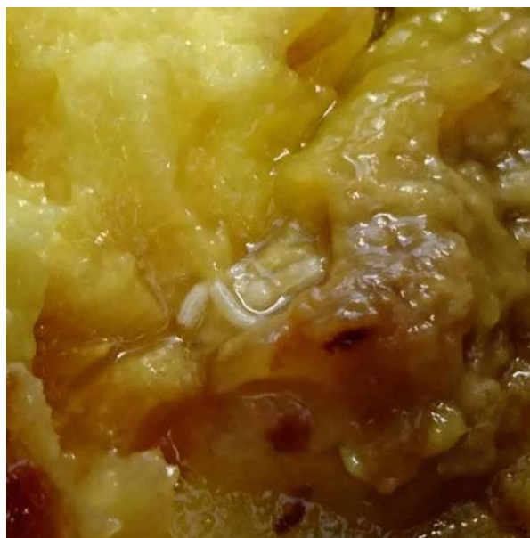
芒果受害後之幼蟲