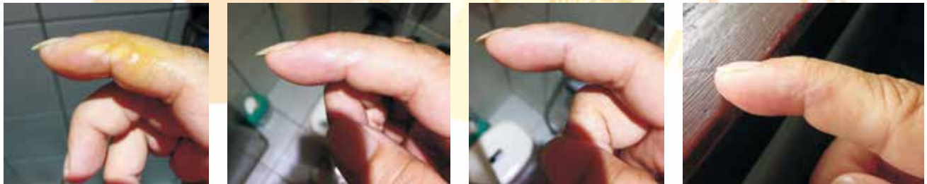
圖三、皮膚修復精華油使用於燙傷處理 左一圖為剛燙傷冰敷後使用，左二圖為使用後6小時（使用30分鐘後已不痛）， 左三、四圖為處理後第二天及第三天之外觀。