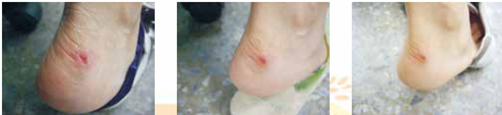
圖二、皮膚修復精華油使用於傷口癒合情形 左圖為塗抹精華油前之傷口外觀，中圖為塗抹精華油9小時後之傷口外觀， 右圖為塗抹精華油11小時後之傷口外觀。