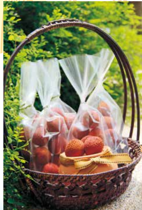
圖2. 紅潤的荔枝乾果，不但色澤自然紅潤，容易剝殼品嚐，更有獨特的荔枝香甜風味，會令人回味無窮ㄟ。