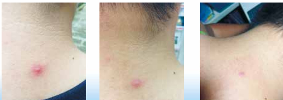
圖四、皮膚修復精華油使用於青春痘 左圖紅腫痛、發炎中的青春痘，中圖為無擠膿、直接塗抹後7小時（不痛了）， 右圖為處理後第二天，傷口縮小結痂。