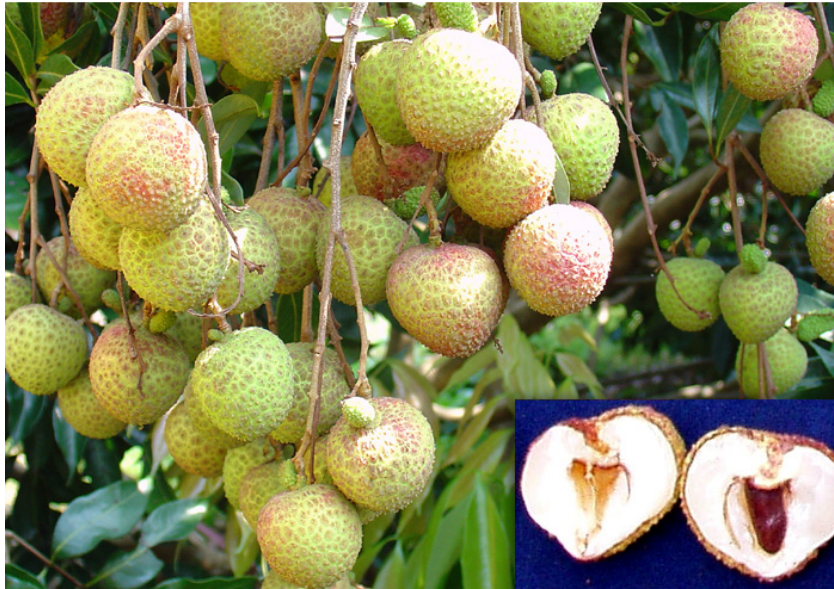
圖 2. 荔枝台農 1 號(76-C-2)之果實。