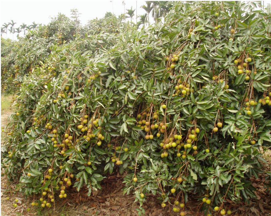
圖 3. 荔枝台農 1 號(76-C-2)之產量高。