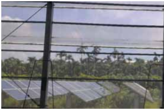
圖一、地面型太陽能板。

作物因溫室內太陽能板部分遮蔽，產生光線不均勻的狀況而影響其生長，有研究指出可藉由太陽能板內側鋪設散射膜(F-clean diffuse)來改善，藉由散射膜