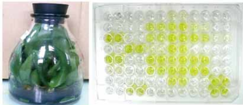
圖二、受病毒感染之蘭花常呈現無病徵或瓶苗期病徵不明顯，透過實驗室檢測方可確保病毒之發生種類，維護種苗生產及出口品質。圖左：ELISA檢測法，由呈色深淺及其讀值判讀病毒濃度。

產，可因應不同國家之檢疫要求，協助產業界蘭花種苗輸出之病毒檢疫檢測服務，達到產業出口貿易之品質控管與順利出口。其中常見之CymMV及ORSV抗體，並已以非專屬技術授權案授權於生物科技公司開發免疫快篩試條或病毒檢測試劑銷售，以及授權於產業界做為為內部品質控管之自主病毒檢測等。整體技術之應用，對於蘭花產業發展之穩定與出口貿易之競爭力提升具有關鍵性之效益。蘭花種苗出口之病毒檢疫流程如圖三所示，可提供產業界在輸出種苗時之參考依據。