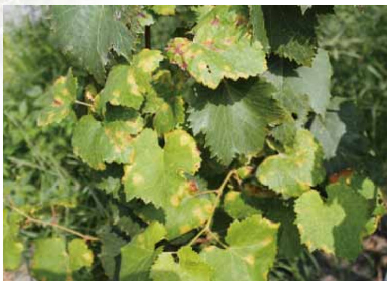
圖一、葡萄露菌病，造成葉片黃斑，影響葡萄產量與品質。