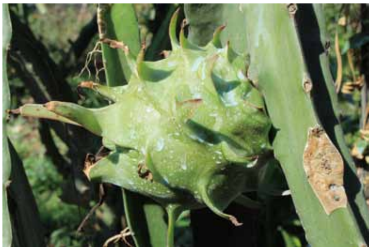
圖二、波爾多液提供一層「保護膜」，因為此藍色表層不容易擦拭，不建議直接噴灑於花或果實表面(圖為紅龍果幼果)。