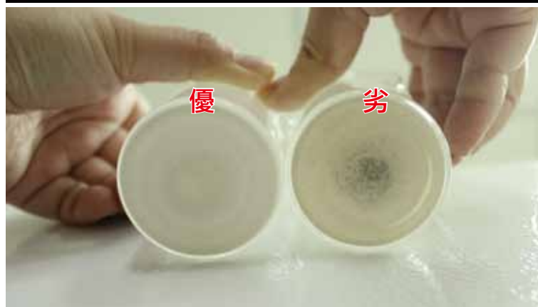
圖六、熟石灰品質優(左)劣(右)差異大，應選擇純度高呈現純白乾淨狀態之熟石灰。