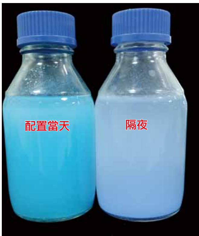
圖五、配製混勻後當天使用，建議10小時內使用完畢，否則藥劑容易變質，效果降低。