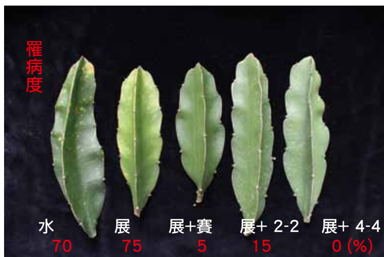
圖七、4-4式波爾多液防治紅龍果莖潰瘍效果不亞於一般化學藥劑。(展：展著劑；賽：賽普護汰寧；2-2：2-2式波爾多液；4-4：4-4式波爾多液)

中都是使用品質優良的熟石灰，呈現的防治效果也十分良好。若對熟石灰的品質有疑慮，建議改採用生石灰調配，但需要注意上段所描述的現象。