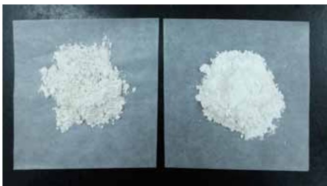
圖四、純度高生石灰以及熟石灰呈現純白乾淨狀態。

部分農民曾經反映熟石灰配置出來的效果防治效果不佳或溶解度差。由於市售熟石灰的品質參差不齊，品質不佳的產品時常含有許多雜質而不易溶解，而很難與硫酸銅混合均勻(圖六)。筆者實際施用或試驗