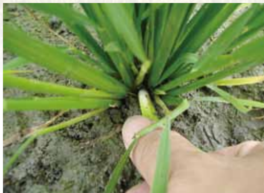
圖八、將稻稈抓緊向後拔出。