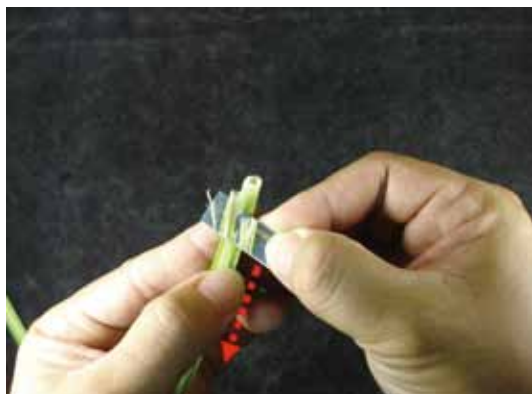
圖十六、修切時應小心分多次薄片平面修切，以防切掉幼穗。