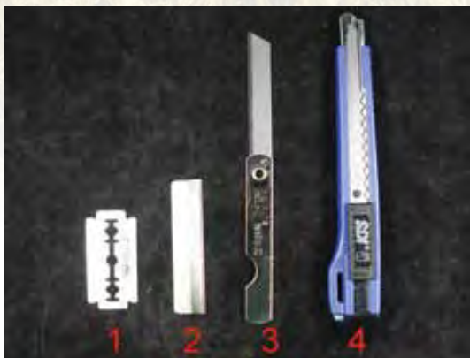
圖二、幾種簡便切穗刀具：1.舊式刮鬍刀片、2.理容用刀片、3.超級小刀、4.美工刀。

非熟練人員不要使用。(2) 理容用刀片為理容院修臉時使用刀片，目前均改良成可替換式，使用時需將刀背金屬護套拆除以免影響操作（圖四），此種刀片也非常鋒利需注意使用安全，價格較貴為