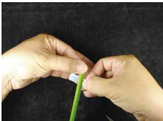
圖十三、左手移至稻稈上方。