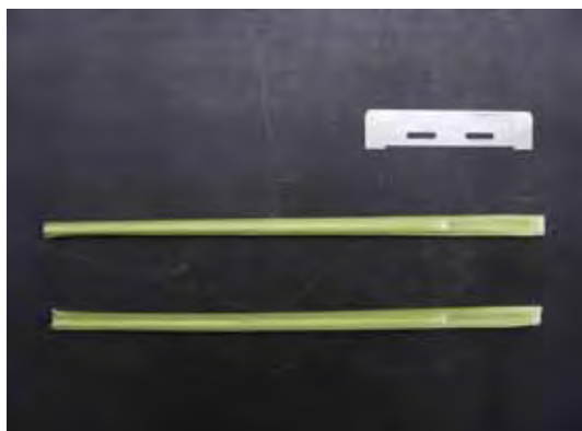
圖十五、稻稈縱切後成均勻兩半。