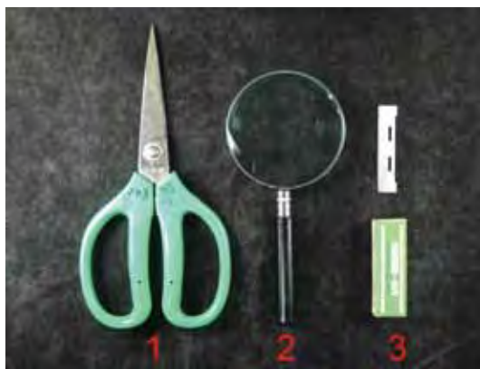
圖一、幼穗解剖時所需使用之工具：1.剪刀、2.放大鏡（3-10倍）、3.刀片。

在進行水稻幼穗解剖時必須使用到的簡易工具有剪刀、3-10倍放大鏡、刀片（圖一），其中刀具選擇最為重要，原則上刀刃必須要薄且鋒利，本文介紹幾種簡便、價格便宜且較易取得的刀具（圖二）：(1) 舊式刮鬍刀片為專業研究人員最常使用的刀片，具有鋒利且刃薄的特性，但由於刀片太寬，且雙面刀刃、中間有空洞不利於操作，使用時可以斜口鉗自中間剪開（圖三），但因太鋒利，使用時不小心很容易受傷，建議