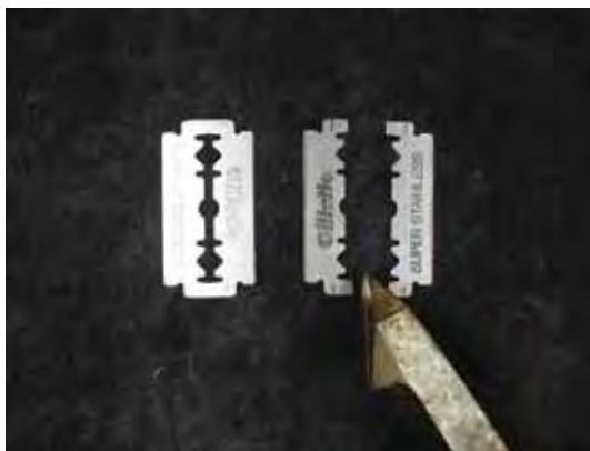
圖三、刮鬍刀片拆解方法，以斜口鉗自中間剪開。