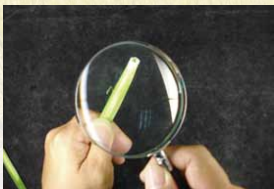
圖十七、修切完成之稻稈，以放大鏡觀看幼穗情形。