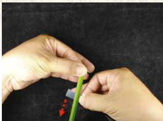
圖十四、刀片順勢下切。