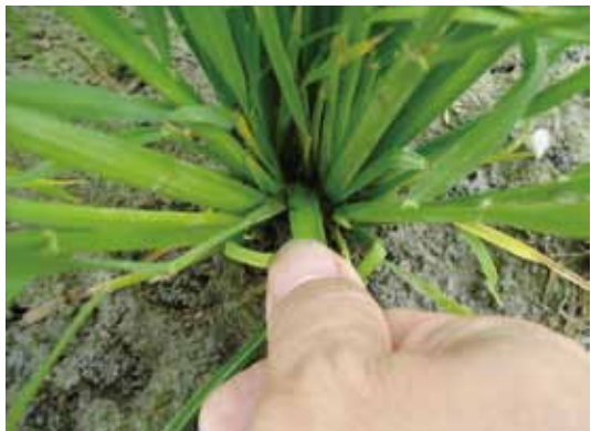
圖七、抓緊後以姆指靠根際下折並可略微左右搖晃，此時會聽到稻稈清脆的斷裂聲。