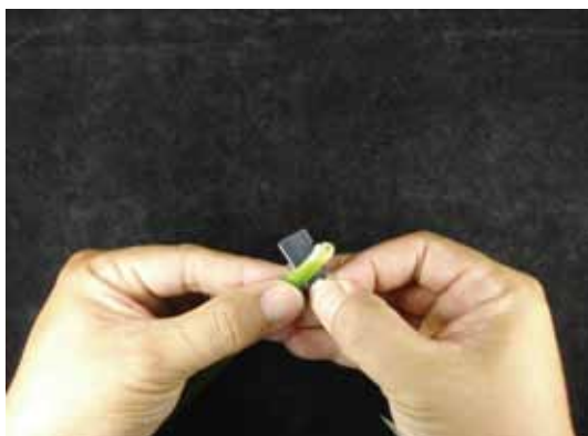
圖十二、由於下位節較密，故剛開始縱切時阻力較大，可以下方手指靠緊，緩慢控制下切力道，防止受傷。