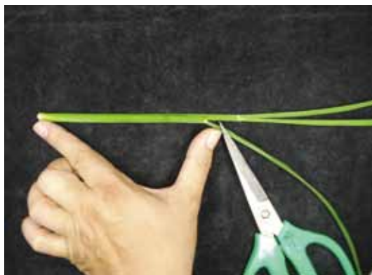
圖九、清洗後進行修剪，約留15-20公分。