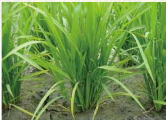
圖五、分蘖盛期，即將幼穗分化的水稻植株。

至稻稈上方以姆指及食指緊抓稻稈（圖十三），右手抓住刀片順勢下切，將稻稈平均縱切成兩半（圖十四、十五），由於縱切時直列的葉鞘維管束較硬，可幫助刀刃順勢滑行，因此如果前處理葉鞘剝除太多，則切口容易偏掉，不容易均分稻稈；雖然縱切時已儘量將稻稈均