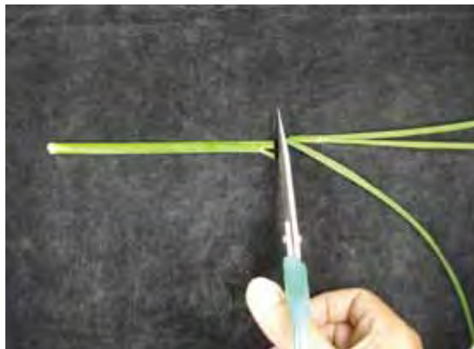
圖十、多餘稻稈剪除，方便作業。