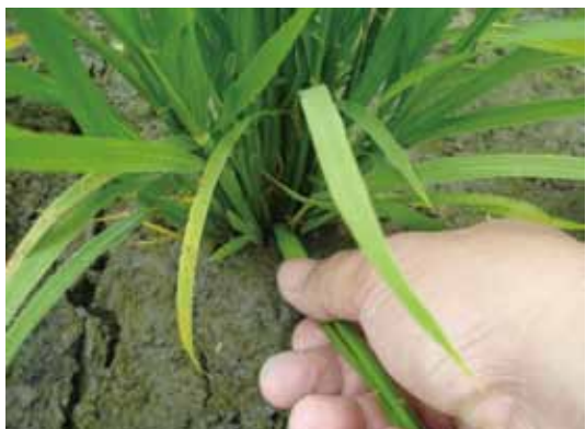
圖六、選取較粗壯之分。