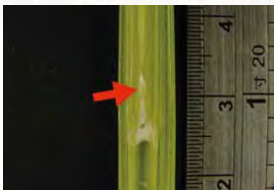
圖十八、當幼穗達2公厘(約米粒橫切面大小)時，目視即可看到一團棉絮。

梗)。由於幼穗剛開始分化時通常非常微小(如筆尖大小)不易判別或根本看不到，此時亦不必灰心，因此現象即表示幼穗尚未分化到一定程度，可間隔2天再次取樣觀察，毋需每天觀察；就筆者經驗，通常當幼穗達1公厘以上不需要很熟練的技巧即可很容易切到、觀察到。