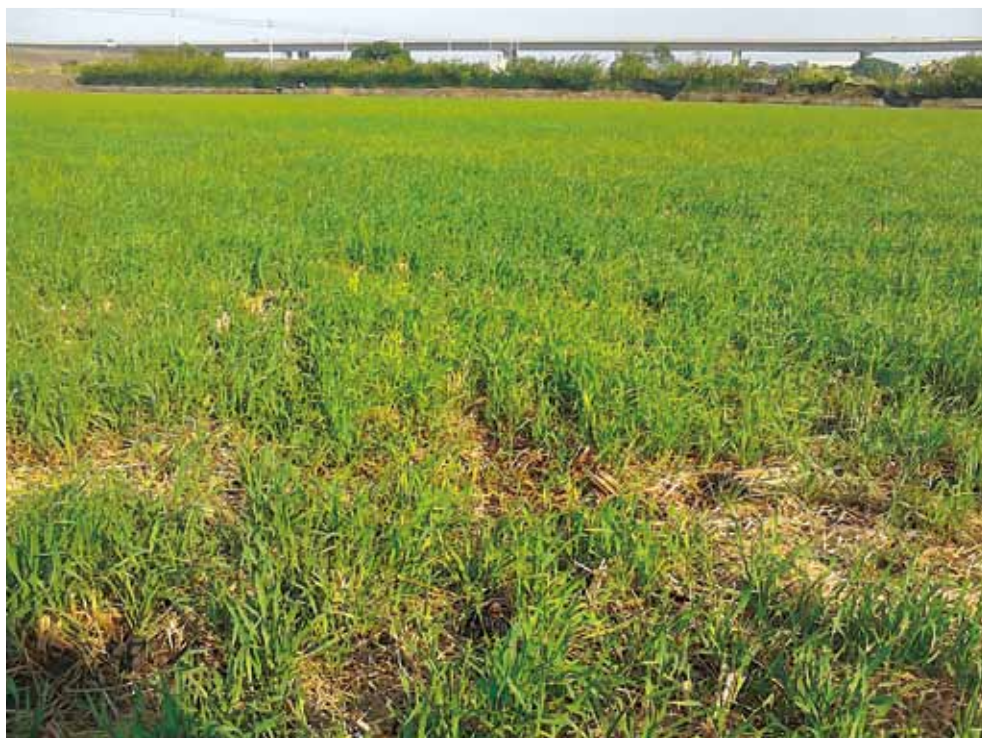
圖一、2013年在中部地區第二期作水稻收穫後利用稻稈覆蓋灑播小麥之栽培現況。

隨著水稻DNA分子標記和相關統計分析模式的開發與應用，以及高世代分離族群的構建，在日本水稻基因組計畫(Rice Genome Research Program, RGP)，曾大規模化對籼粳雜交組合Nipponbare/Kasalath衍生的F 2 族群、回交族群和QTL近同源系族群分別進行遺傳分析，定位出 Hd1 至 Hd14 等14個抽穗期QTLs (如圖