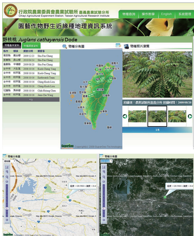
圖 3. 台灣胡桃的地理分布資訊。

示點位座標資料的建置。該系統透過地理資訊系統，將地理空間資訊以地圖方式顯示物種的地理分布圖，呈現園藝作物野生近緣種的分布情形。專業人員或研究人員經由需求申請，透過地理資訊系統可以查詢園藝作物野生近緣種詳細的點位座標，利用地圖工具列的放大、縮小、平移及放置全圖等功能，應用衛星地圖或道路圖資訊找到台灣地圖上該物種所在的正確位置。例如，台灣胡桃 (野核桃) ( Juglans cathayensis Dode) (圖 3) 屬喬木可達 25 m 高，在台灣分布於海拔 1,200–2,000 m 的森林，對照在中國伊犁的果樹近緣種資料，包括野核桃 ( Juglans regia L.) 等野果林組成，屬喬木有 14 個種下野生類型，主要分布在鞏留縣核桃溝，則分布於海拔 1,280–1,300 m (Hou & Hsu 2006)，藉此獲得野生近緣種的地理分布資訊。