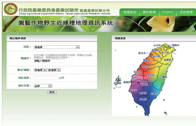
圖 1. 園藝作物野生近緣種地理資訊系統的物種查詢頁面。