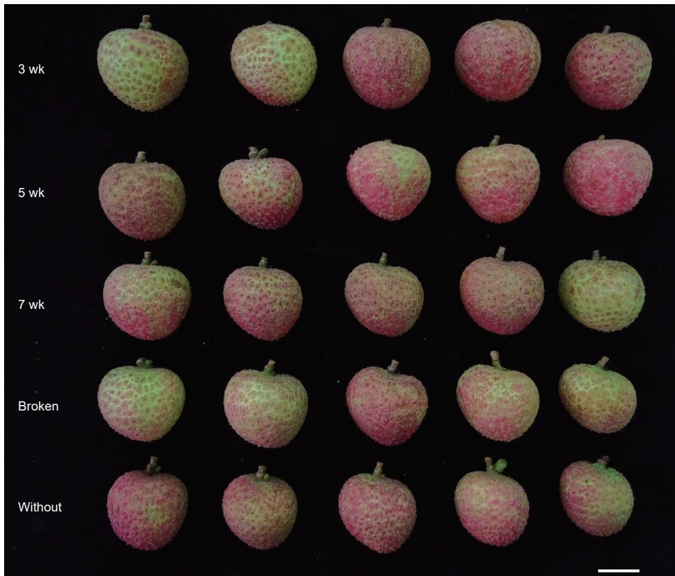
圖 2. 以綠色聚乙烯網袋套袋處理「台農 1 號」荔枝所穫果實外觀，由上而下分別為偏雌花盛開後第 3 週、第 5 週、第 7 週套袋，偏雌花盛開後第 3 週套破網袋處理，以及不套袋處理。Bar = 2 cm。